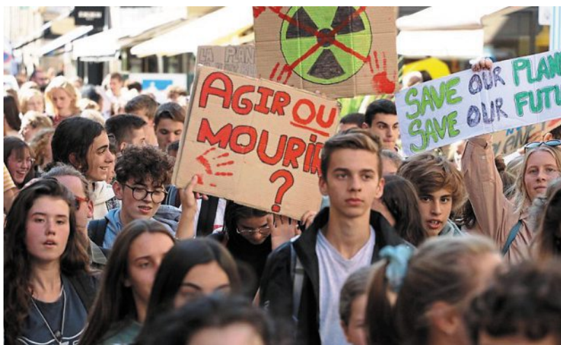
Lors d'une précédente marche pour le climat dans le centre-ville de Caen, le 20 septembre 2019.

Samedi, une marche pour le climat est organisée à Caen, alors que les dirigeants du monde sont réunis à Glasgow pour la Cop26.